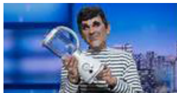
Une marionnette « made in France ».

La campagne pour les élections au Parlement européen dans les médias français n'a guère été l'occasion de réfléchir à un approfondissement de l'Union. Elle a plutôt servi de faire-valoir aux divisions et aux nationalismes. S'agissant de l'Hexagone, un certain complexe de supériorité nous fait trop souvent penser qu'il n'y a de progrès que dans le « made in France ».