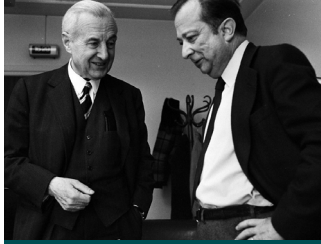
Hubert Beuve-Méry et Pierre Desgraupes.

La société va toutefois fortement évoluer pendant ces quatre décennies, avec l'accroissement du bien-être, la montée des individualismes, et surtout la perte de vitesse des idéologies qui avaient façonné la collectivité, sur la base de « valeurs » morales fortes et prégantes. Le monde médiatique explose à partir des années 1980 (libéralisation de l'audiovisuel, début des nouvelles technologies de l'information et de la communication avec l'informatique, le câble, le satellite, la télématique)... Mais il est aussi marqué par deux phénomènes dont on ne cesse de ressentir