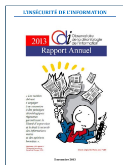
Le premier Rapport de l'ODI (novembre 2013).

(différente de celle des Etats-Unis, par exemple, et à l'opposé de nombreux Etats plus ou moins totalitaires sur la planète) fait de la loi la garantie du « vivre ensemble ». Henri Lacordaire, fondateur des dominicains et éphémère député de la République en 1848, a écrit : « Entre le fort et le faible, entre le riche et le pauvre, entre le maître et le serviteur, c'est la liberté qui opprime et c'est la loi qui affranchit ». La mise en œuvre de cette liberté « sous condition » ne se gère qu' a posteriori , la censure envers les médias n'existe plus en France depuis la fin de la guerre d'Algérie. ( lire la suite page 4 )