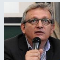
Pierre Laurent sénateur de Paris, secrétaire national, PCF

« Passons à l'acte, avançons, donnons-nous un calendrier. »