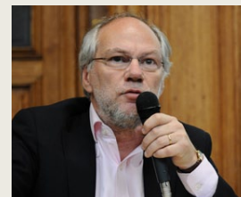
Laurent Joffrin directeur de la rédaction, Le Nouvel Observateur

« Aujourd'hui, le déontologue de la presse, c'est le juge. »