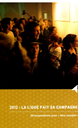
2012 : LA LIGUE FAIT SA CAMPAGNE 50 propositions pour « faire société »