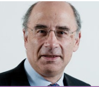
Le juge Leveson

La pratique des écoutes téléphoniques et de l'espionnage informatique était si répandue dans la rédaction du défunt News Of The World que les journalistes ont adopté un mot d'argot pour ces pratiques : screwing . On constate qu'une fois la boîte de Pandore ouverte, la transgression n'avait plus de limite, les journalistes utilisaient les mêmes moyens pour s'espionner les uns les autres, dans une guerre des services. Si on en croit les témoignages recueillis par le juge Brian Leveson, qui enquête sur les pratiques illégales de la presse Murdoch, la salle de rédaction d'un « tabloïd » comme News Of The World (l'ex plus grand journal de