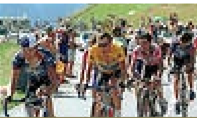
Tour de France 2002.

L'Union syndicale des journalistes CFDT, dans un communiqué du 24 octobre 2012 1 , s'interroge sur l'attitude des journalistes sportifs à propos de l'affaire du dopage du coureur américain Lance Armstrong, déchu de son titre pour sept Tour de France. Cette question est bien venue. L'omerta qui règne depuis des décennies sur les pratiques illégales en usage sur la Grande boucle n'est-elle pas tout aussi dommageable pour l'information que les connivences dont on accuse, souvent à juste titre, les journalistes de la sphère politique, par exemple ?