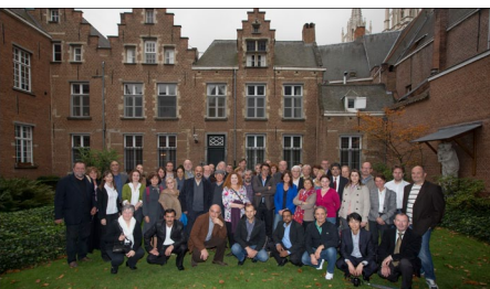
Les responsables des 35 pays à Anvers

L'ancien hôpital Elzenveld d'Anvers a réuni du 17 au 19 octobre 2012 les représentants de 35 pays (dont 9 hors Europe continentale) lors de l'Assemblée des Conseils de Presse Indépendants d'Europe, AIPCE. Deux éléments à retenir des présentations des rapports nationaux : la présence de plus en plus marquée des juristes dans la composition des conseils, et la poursuite de la création d'instances de régulation dans les Balkans. Parmi les sessions de travail aux thématiques diversifiées, nous en avons retenu surtout trois.