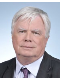
Michel Françaix, député PS, rapporteur pour la presse écrite.

Michel Françaix, député PS de l'Oise et rapporteur pour avis sur la presse écrite de la loi de finances 2013, consacre dans son rapport 1 un passage important aux évolutions du système des aides publiques aux éditeurs, et notamment aux « obligations renforcées » qui pourraient les conditionner dans l'avenir (après 2013). Rappelant les fortes critiques et la défiance grandissante du public à l'égard des médias, ainsi que les recommandations non suivies d'effets des États Généraux de la Presse Ecrite (« Malgré son caractère équilibré, le « code Frappat » n'a pas réussi à fédérer autour de lui l'ensemble de la profession et la mission a échoué. »), il écrit notamment : « Nul ne conteste l'importance capitale, pour l'exercice de la démocratie et du débat public, d'une presse écrite de qualité, qui analyse et mette en perspective une actualité vérifiée et hiérarchisée. C'est là la justification première du système d'aides à la presse et c'est pourquoi, s'agissant des éditeurs de titres d'information politique et générale (IPG), le rapporteur pour avis estime que le respect d'un code de déontologie pourrait être une condition au bénéfice des aides de l'État. »